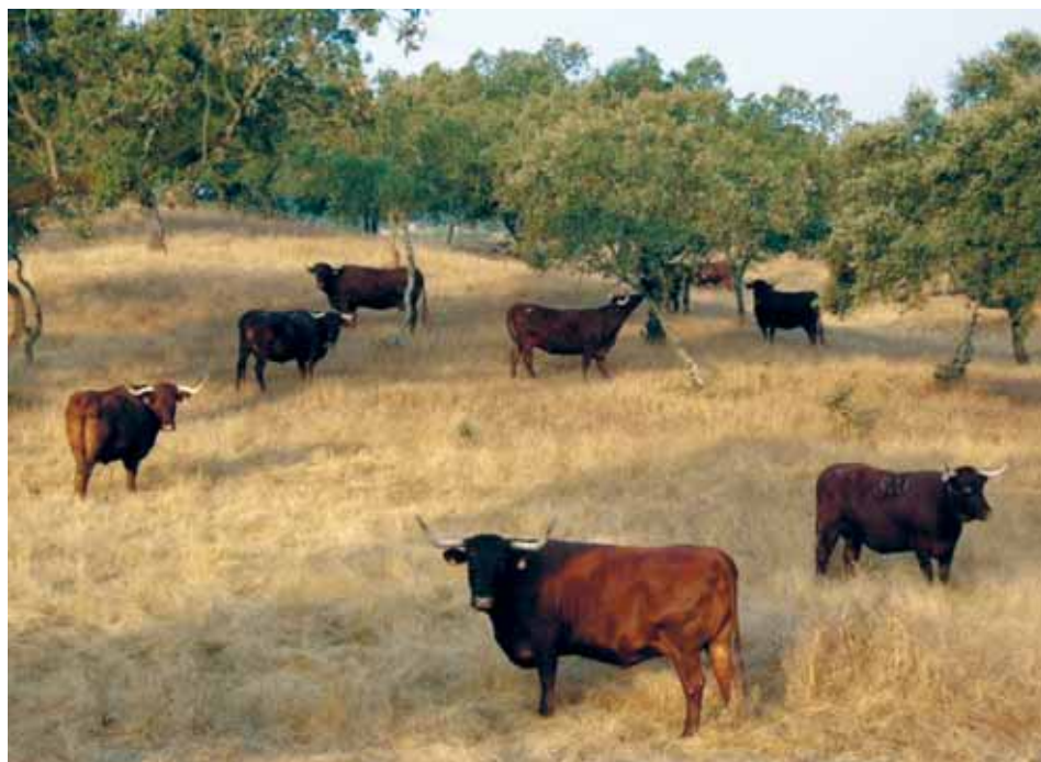
Vacas Retintas en ramoneo.

Comerse los animales las hojas y las puntas de los ramos de los árboles es bastante frecuente una o dos veces al año, utilizándose este sistema para cubrir periodos de necesidades del ganado, cuando no hay otros recursos pastables. Se suelen usar la encina, el fresno y algunas retamas de otras especies.