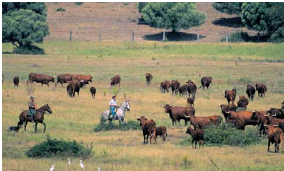
Vacada de animales de la Raza Retinta con vaqueros a caballo.

En el caso de los productores que estén sujetos a programas de certificación de producto, como en ganadería ecológica, Indicación Geográfica Protegida (IGP) o los pliegos de etiquetado