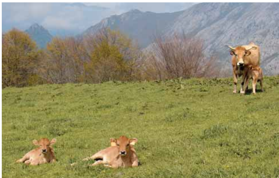
Terneros y vaca de la raza asturiana de la montaña.

El ternero nace desprovisto de defensas, por lo que la ingesta de calostro en las primeras horas de vida resulta vital para conferirle inmunidad pasiva frente a agentes patógenos.