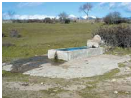
Bebedero en campo.