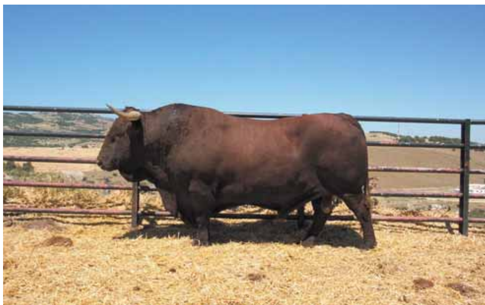
Semental de la Raza Retinta.

Los toros deberán poder hacer suficiente ejercicio