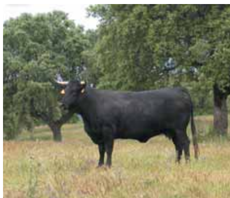
Avileña Negra Ibérica en la dehesa.

durante los meses más duros del invierno se les complementa la alimentación con forrajes y piensos. En este grupo de vacas destacan las razas autóctonas españolas (Avileña-Negra Ibérica, Asturianas, Morucha, Retinta, y Rubia Gallega) aunque también existen razas importadas como la Charolesa y