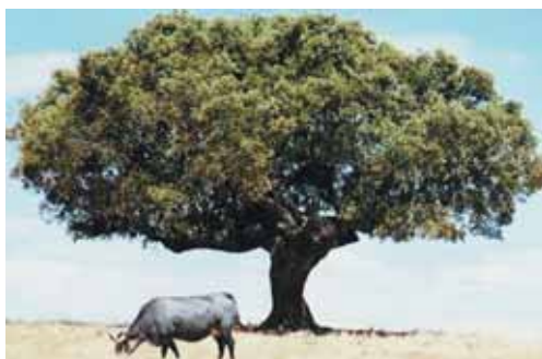
Ejemplar de Morucha pastando al pie de una encina.

Debe prestarse especial interés a la hora de calcular las densidades gana-