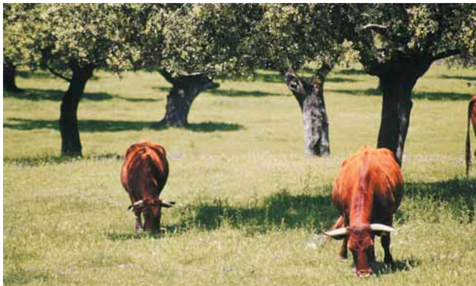
Animales de la Raza Retinta pastando en campo.

dehesa fría y áreas de alta montaña, como Pirineos y Asturias.