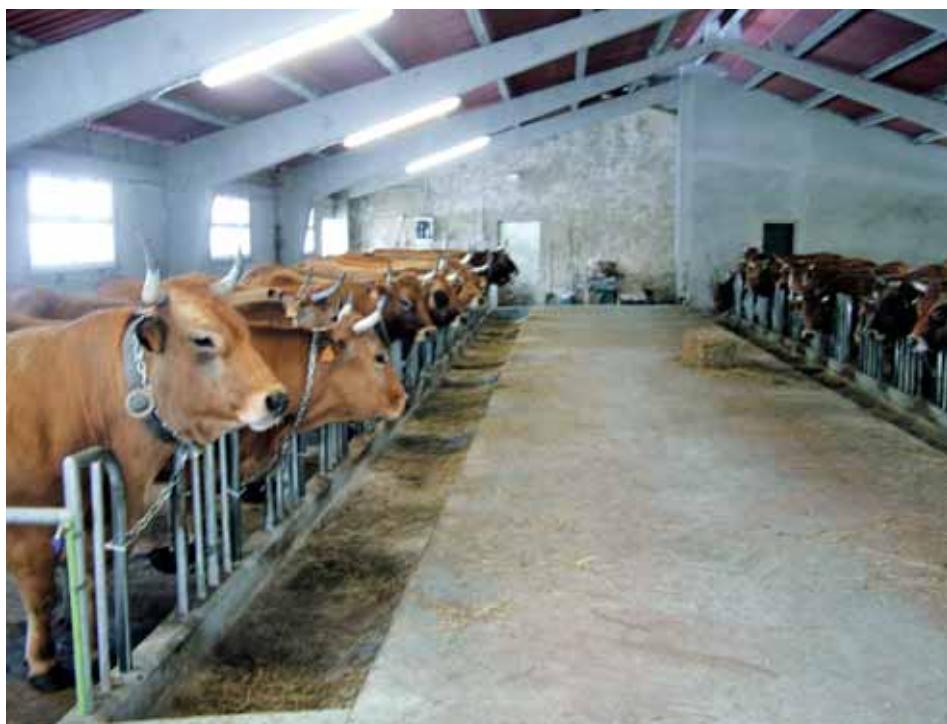
Explotación de la raza Asturiana de los Valles.

Lazareto: Se deberá disponer de un alojamiento apropiado para tratar a los animales enfermos o heridos a fin de que se les pueda separar o, llegado el caso, aislar. Deberá estar situado en unas zonas aisladas, bien orientadas y apartadas del resto de los animales en un lugar especialmente tranquilo.