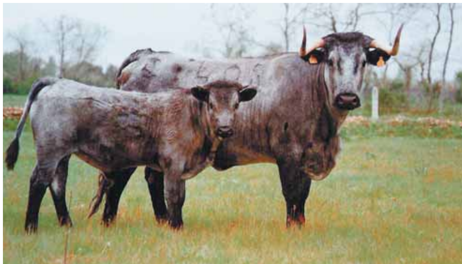
Vaca con cría de la Raza Morucha.

El ganadero deberá cerciorarse de que el ternero recién nacido reciba