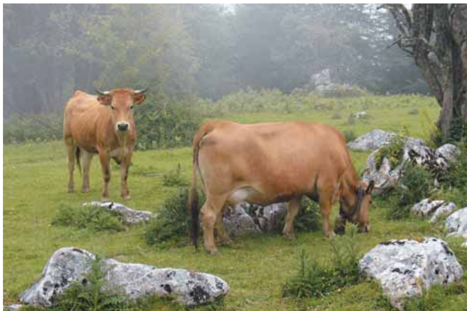
Ejemplares de razas asturianas.

Como en general, no se conocen ni la disponibilidad de los minerales en el