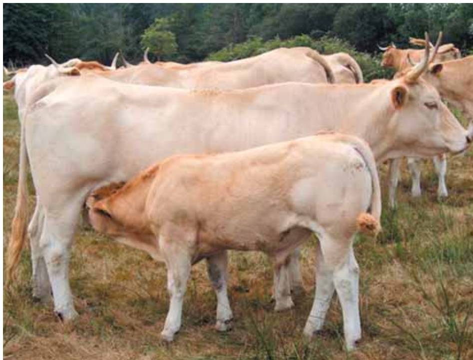
Vaca Pirenaica con ternero.