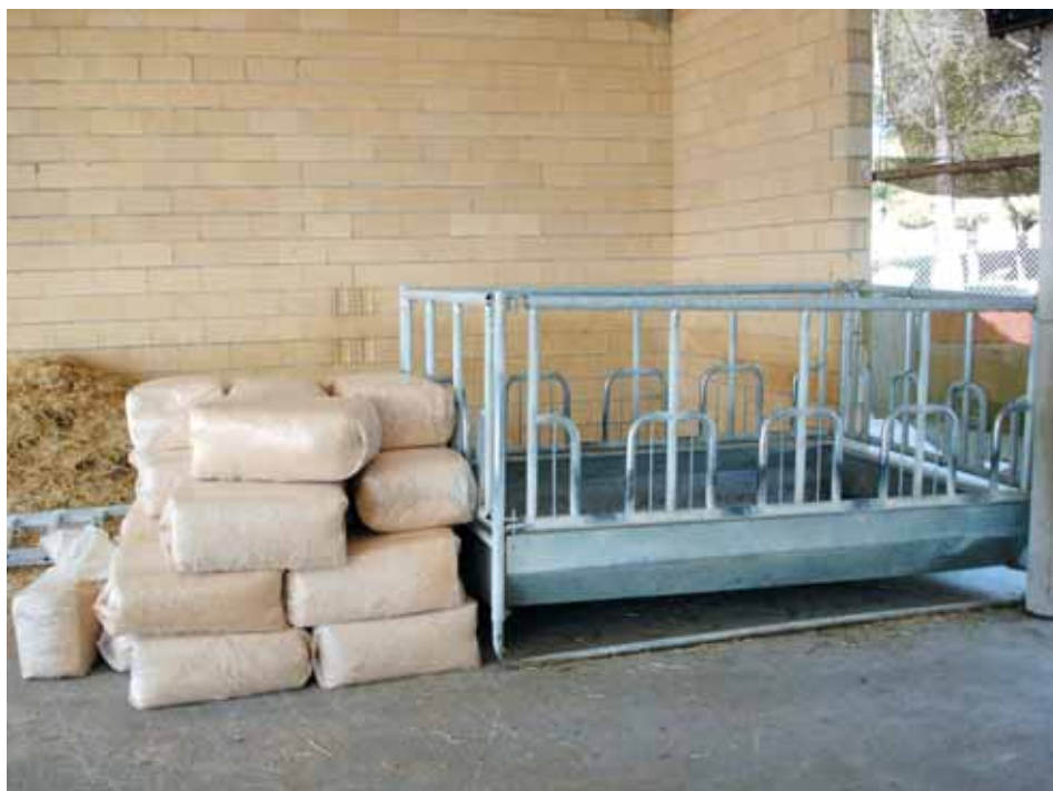
Sacos de pienso medicamentoso almacenados.

Solamente los profesionales con la cualificación y formación adecuada tendrán acceso a este botiquín y podrán administrar los medicamentos a los animales.