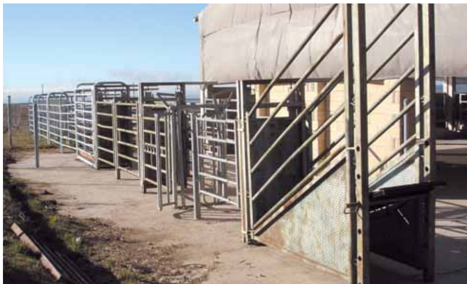
Manga de manejo.