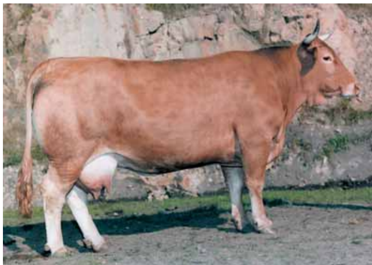
Hembra de la raza rubia gallega.