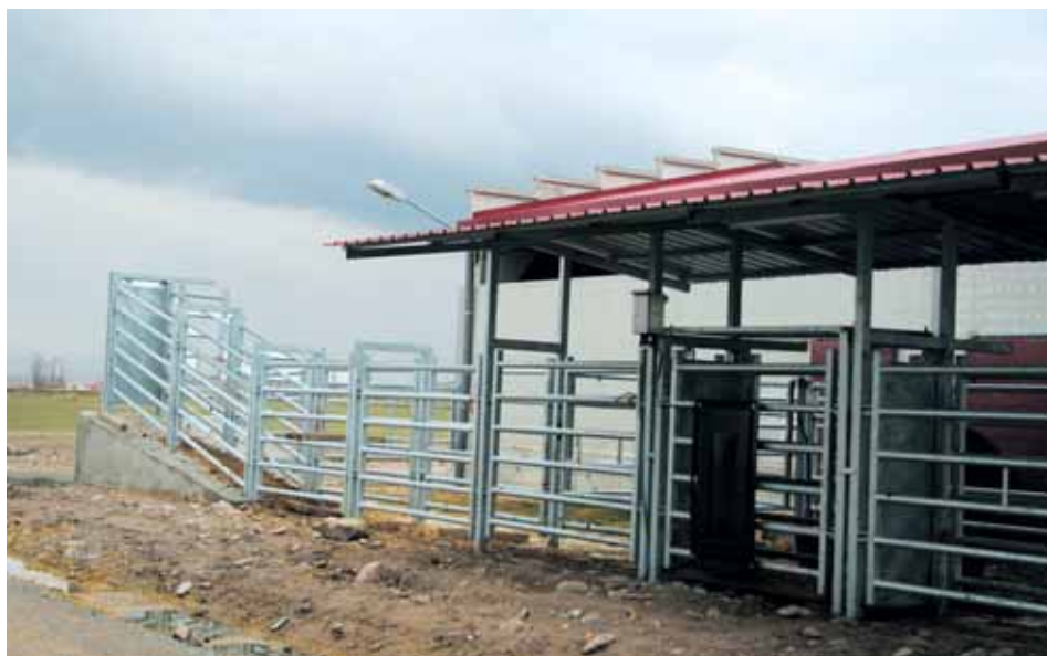
Manga de manejo.

Parideras: En el caso de ganado de reproducción, deberán preverse compartimentos para el parto. El lugar estará aislado, será tranquilo y siempre estará en disposición de una cama limpia y seca, donde no deberán existir restos de los partos anteriores.