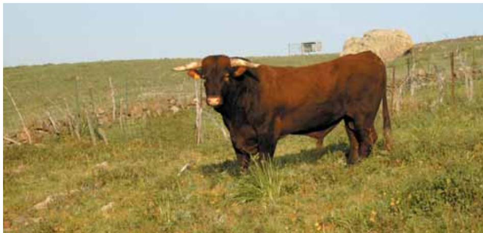
Retinto con verja.