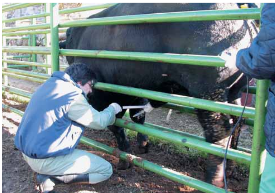
Extracción de semen por electroeyaculación.

El personal dispondrá de aseos y de una fuente potable de agua, así como productos para su limpieza y un botiquín sanitario.