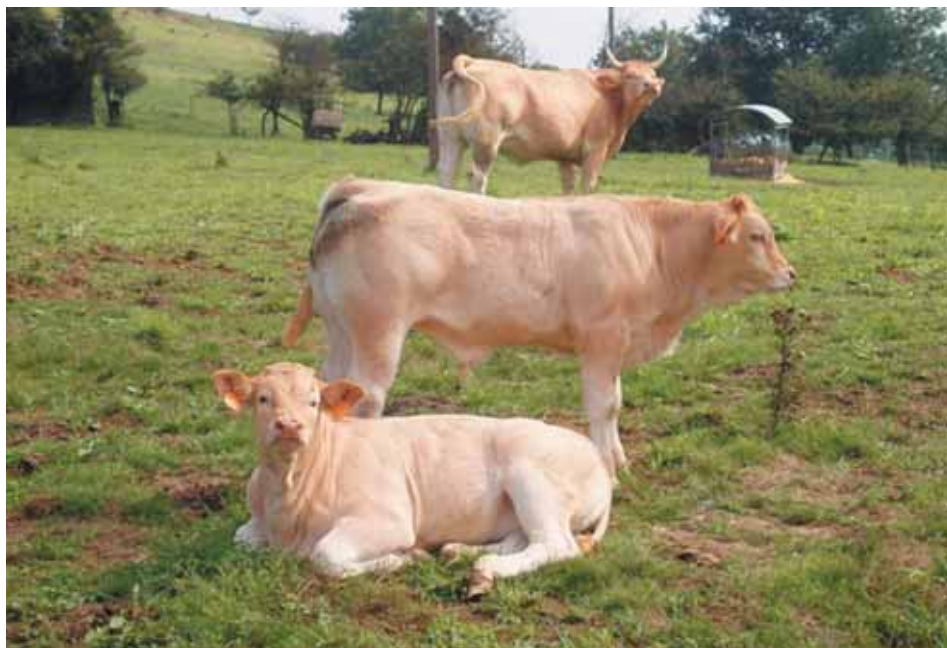
Animales de la Raza Pirenaica.

Los partos de primavera se realizan en zonas con una producción de pasto muy estacional, centrada en la primavera y verano, donde la producción otoñal no está asegurada, ya que depende mucho de la climatología. En España, esto sucede sobre todo en la