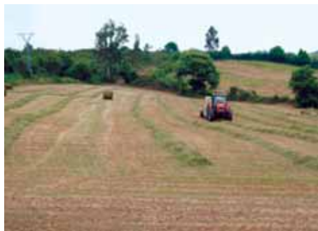
Hierba recién segada para henificar.

Los cultivos forrajeros de invierno más importantes son los cereales en verde, el nabo forrajero, la veza común y el raigrás anual. El cultivo forrajero de verano más importante es el maíz, seguido del pasto de Sudán y del sorgo forrajero.