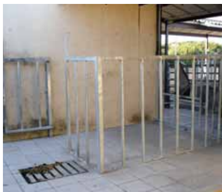
Lazareto o boxer individual.

Henil y almacén: Deberá estar próximo a la nave de los animales, para de esta forma facilitarnos el trabajo, aunque lo suficientemente aislada para