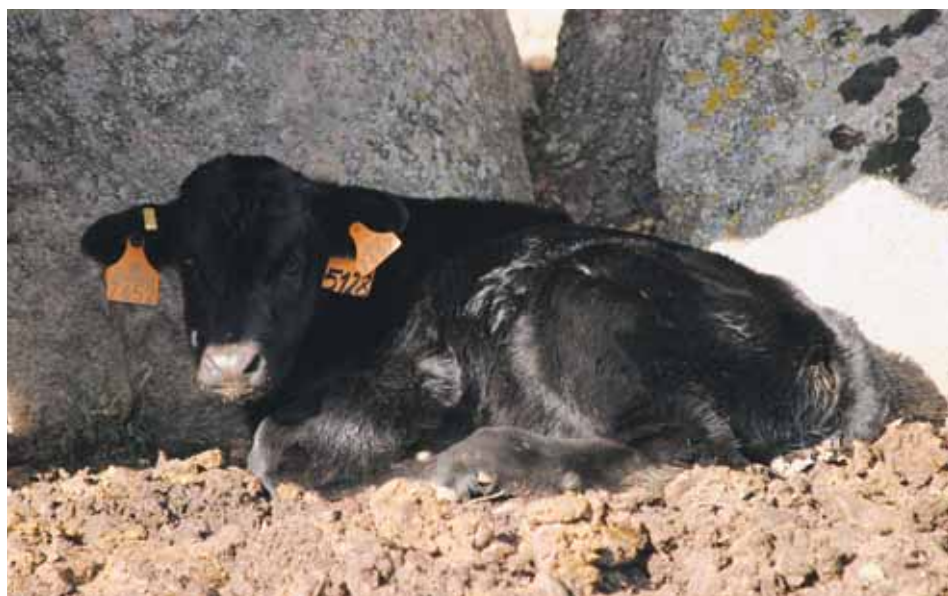
Animal identificado de la Raza Avileña-Negra Ibérica con pocos días de vida.

Los edificios y los equipos destinados al ganado bovino deberán diseñar-