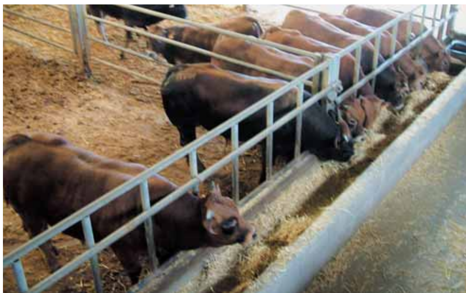
Novillos de la raza asturiana de los valles en cebaderos.

El ganadero responsable deberá tener experiencia y ser competente en las técnicas de partos, y deberá prestar especial atención a la higiene, en particular en el caso de partos asistidos. Deberá cerciorarse de que la vaca podrá lamer al ternero inmediatamente después del parto.