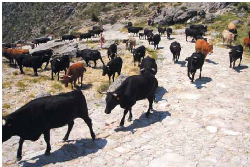
Ganadería de la Raza Avileña - Negra Ibérica realizando la trashumancia.

Los animales se manipularán y transportarán separadamente en los siguientes casos: