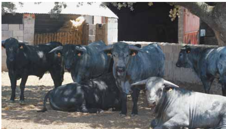
Becerras de la raza morucha en cebadero.

narse cuidadosamente, al menos dos veces al día.