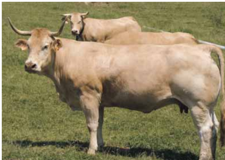
Ejemplar de la raza pirenaica.

transformación y distribución de un alimento, un pienso, un animal destinado a la producción de alimentos o una sustancia destinada a ser incorporados en alimentos o piensos o con probabilidad de serlo.