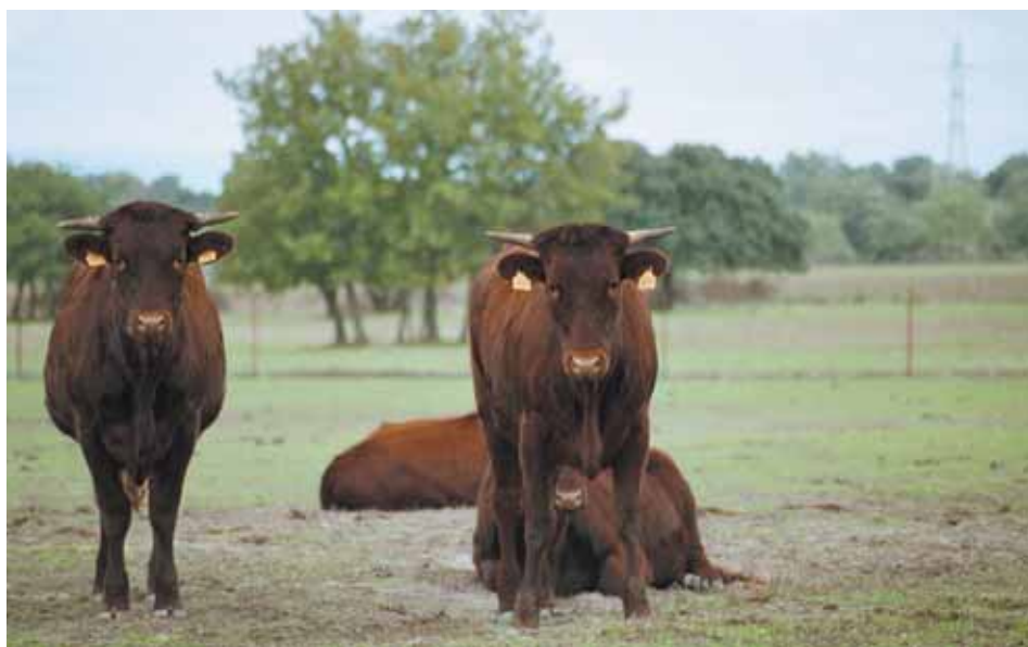
Novillas de la raza Retinta.

La vaca nodriza es un elemento clave a la hora de fijar la población, siendo, en muchas áreas, la única actividad económica sostenible posible. Su desaparición resultaría catastrófica para la población de todas estas zonas, y por tanto, para un espacio rural nor-