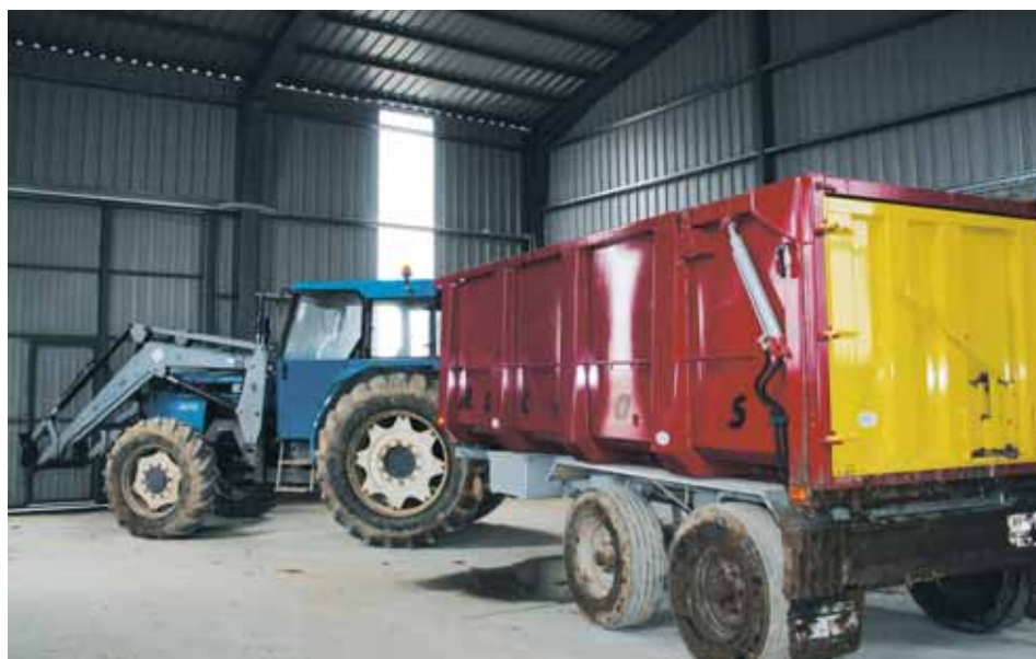
Tractor de trabajo.

Cuando un animal muere en la explotación, debe separarse del resto