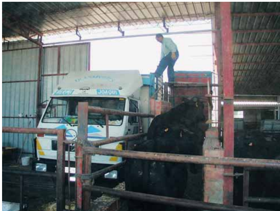
Carga de animales en la explotación.

Los medios de transporte, los contenedores y sus equipamientos deberán diseñarse, construirse, mantenerse y utilizarse de modo que sea posible: