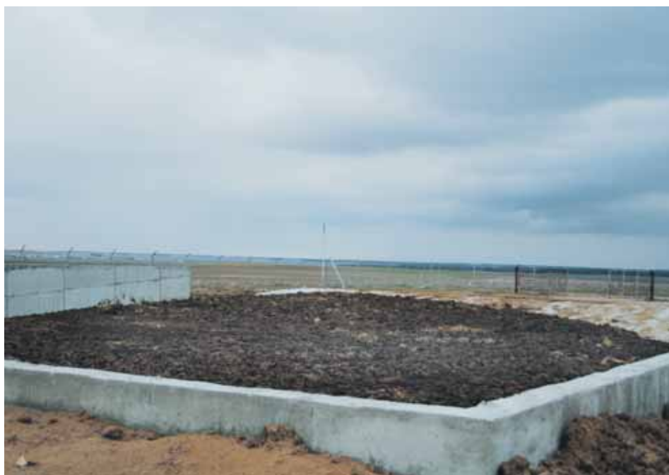
Estercolero con fosa de lixiviados.